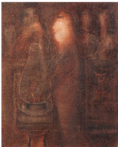
NOČNÍ HOST / olej/plátno, 25 x 20 cm