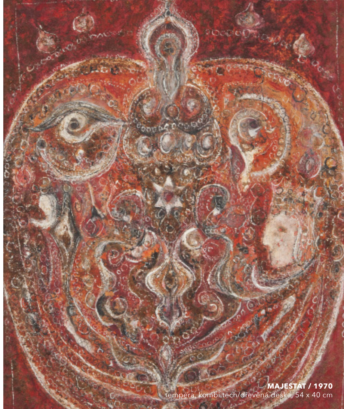
MAJESTÁT / 1970 tempera, kombi.tech/dřevěná deska, 54 x 40 cm