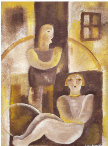
ZAMILOVANÁ / olej/lepenka, 51 x 39 cm