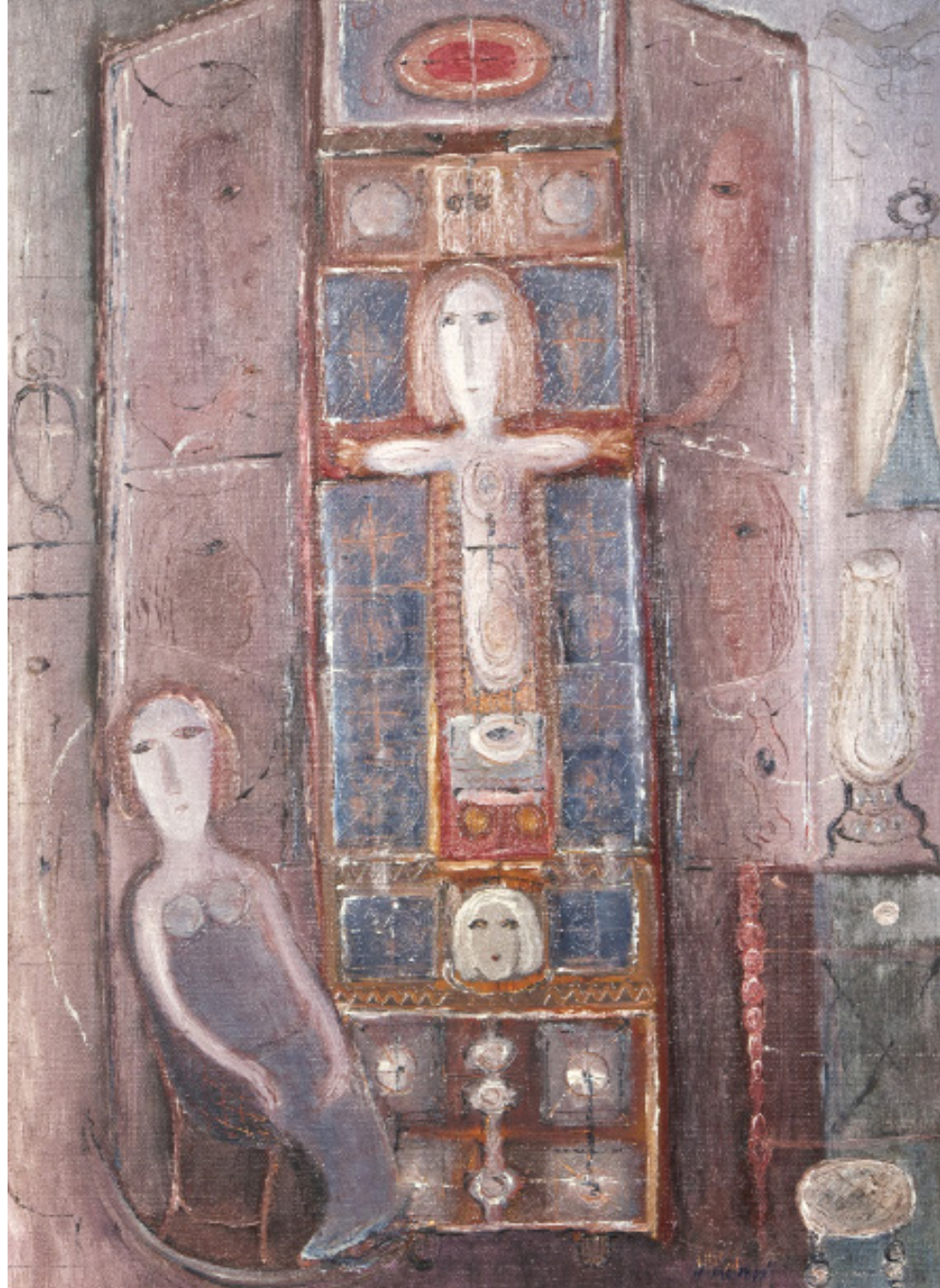
DESKOVÝ OBRAZ / 1971 olej/plátno, 70 x 49 cm