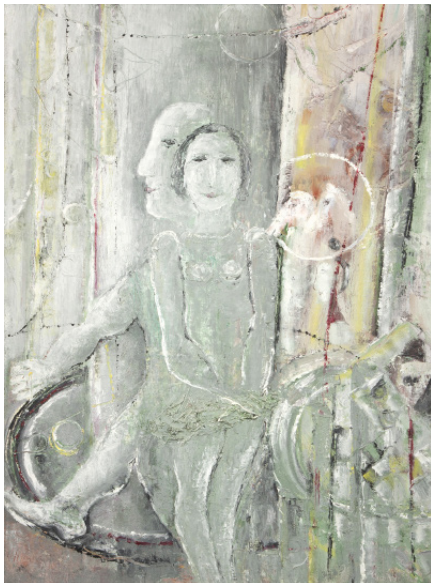
Z VYSTOUPENÍ / 1979 olej/plátno, 80,5 x 60,5 cm