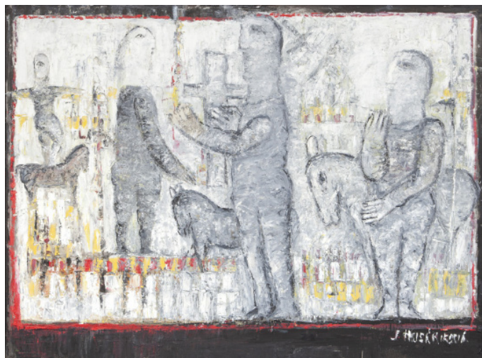
O VELIKONOCÍCH / olej/plátno, 60,5 x 80,5 cm