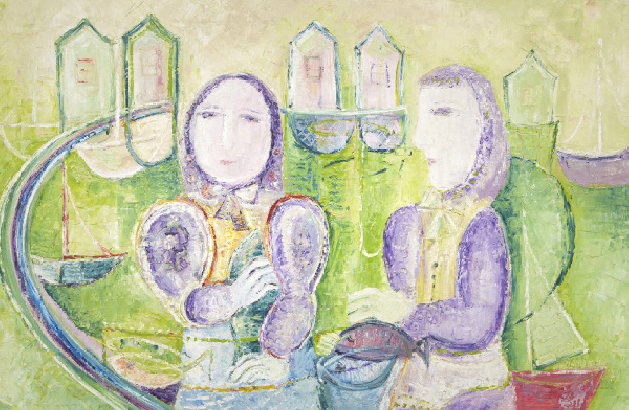
RYBÁŘKY / 1977 olej/plátno, 60 x 90 cm