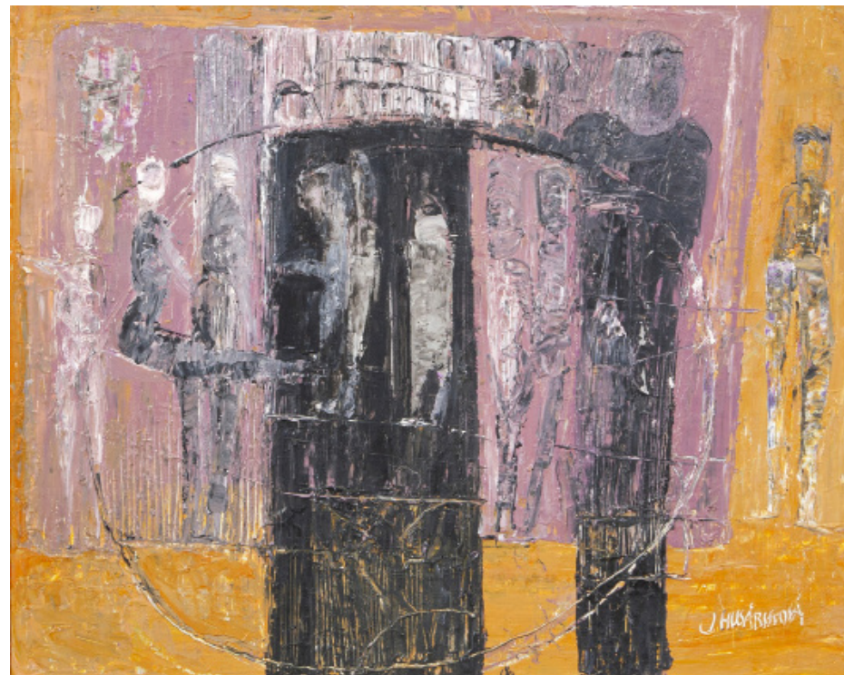
POD DOHLEDEM / olej/plátno, 40 x 50,5 cm