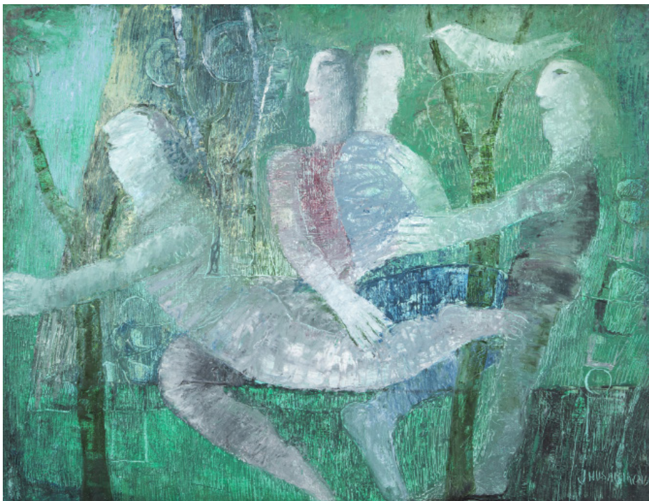
HRY V ZAHRADĚ / olej/plátno, 85 x 110 cm