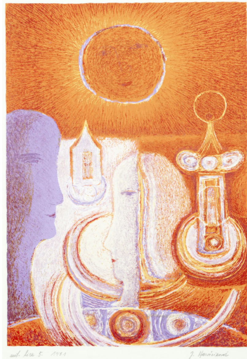
MILENCI / 1971 barevná litografie, plocha 41,5 x 28,5 cm