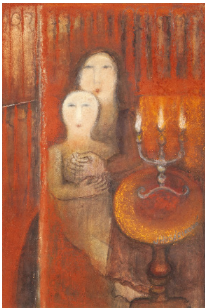
MATKA S DÍTĚTEM / 1981 kombi.tech./papír, ve výřezu 29 x 19 cm