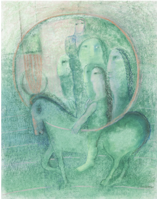
JEDEN Z MNOHA PŘÍBĚHŮ / 2002 pastel/papír, ve výřezu 64 x 49 cm