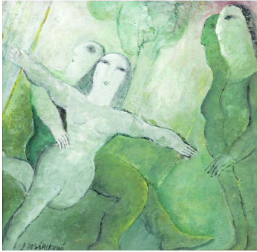
SETKÁNÍ / 1987 kvaš/papír, ve výřezu 23 x 23 cm