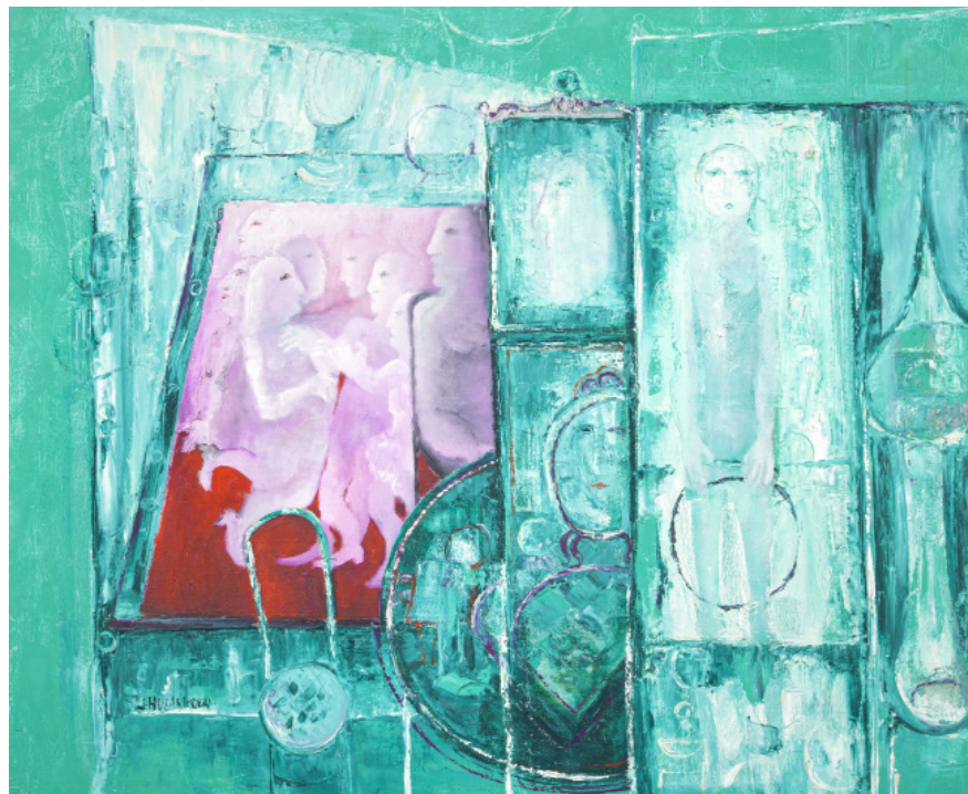
ZÁBAVA V ZELENÉM SVITU / olej/plátno, 100 x 120 cm